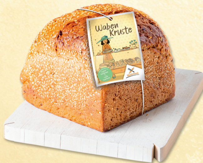
Brotanhänger | DIN A7 am Gummiband | 14 / 28 cm