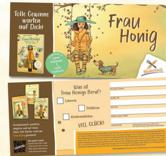
Teilnahmekarte | 210 x 98 mm

Symbolfotos – die gezeigten Backwaren können auf Wunsch durch Ihre Produkte ersetzt werden.