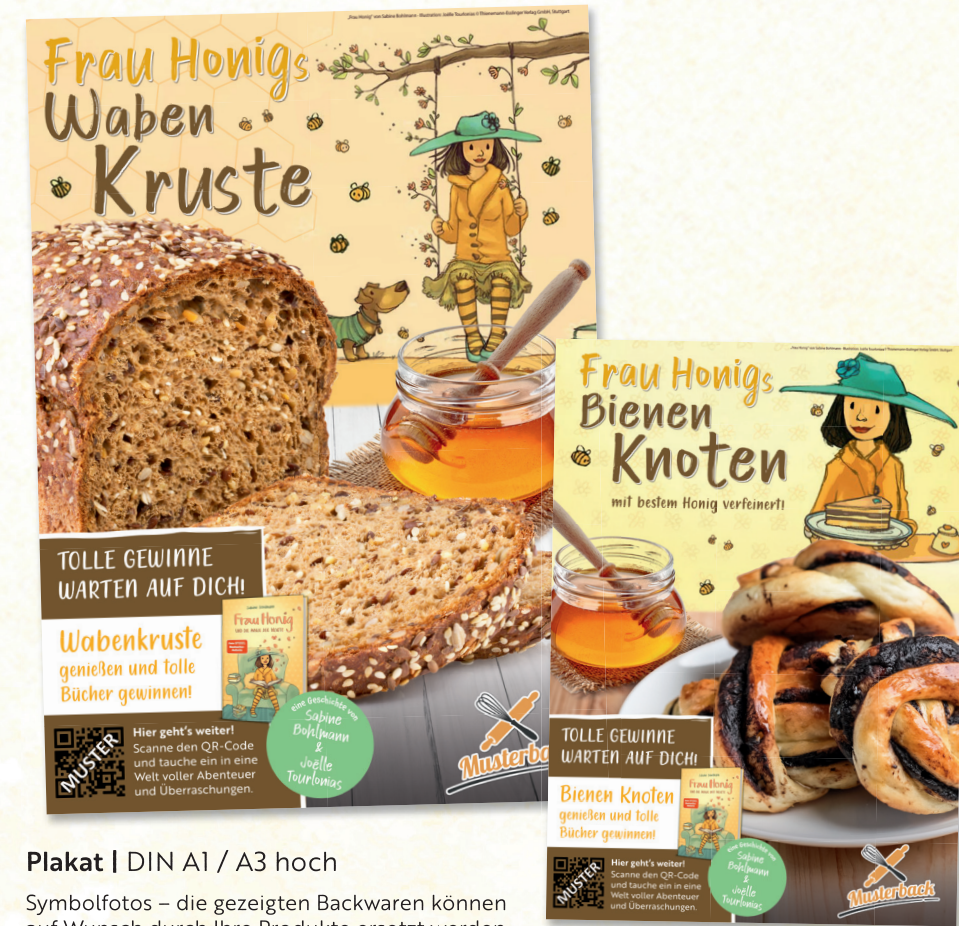
Plakat | DIN A1 / A3 hoch

Symbolfotos – die gezeigten Backwaren können auf Wunsch durch Ihre Produkte ersetzt werden.