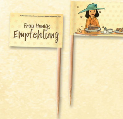
Einsteckfähnchen | 48 x 30 mm