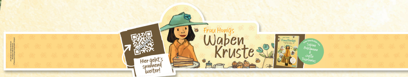
Brotbänderole | 550 mm Länge

Absatzfördernd: Ob als kleine Aktion zwischendurch oder als Promotion für einen längeren Aktionszeitraum, zur Einführung neuer Produkte, zur Produktpflege oder „einfach nur so“ – mit dem zauberhaften Gewinnspiel überzeugen Sie Ihre Kund:innen und fördern Frequenz und Absatz direkt in Ihrem Fachgeschäft.