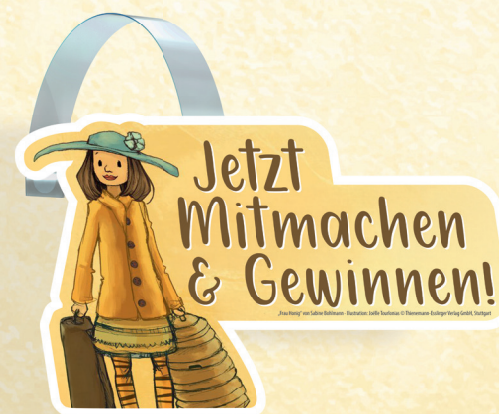
Regalwobbler | 124 x 78 mm