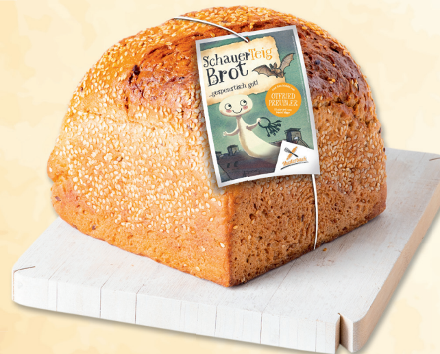
Brotanhänger | DIN A7 am Gummiband | 14 / 28 cm