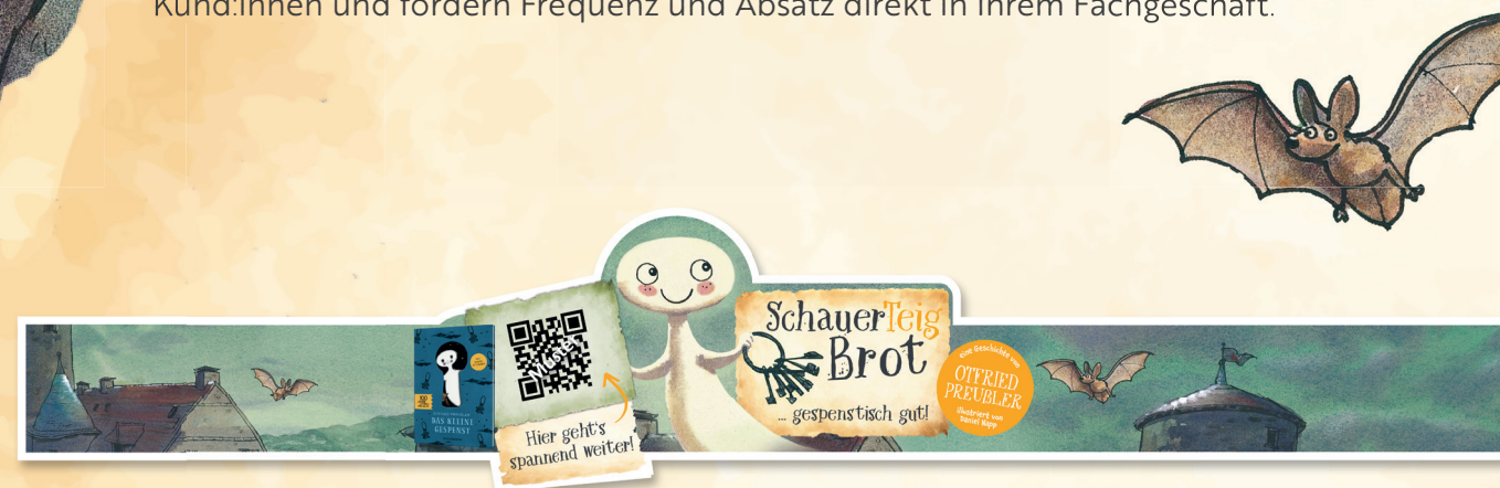
Brotbänderole | 550 mm Länge

Absatzfördernd: Ob als kleine Aktion zwischendurch oder als Promotion für einen längeren Aktionszeitraum, zur Einführung neuer Produkte, zur Produktpflege oder „einfach nur so“ – mit dem gespenstisch-guten Gewinnspiel be-„geistern“ Sie Ihre Kund:innen und fördern Frequenz und Absatz direkt in Ihrem Fachgeschäft.