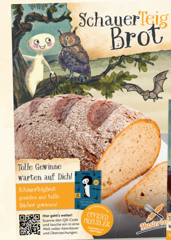
Plakat | DIN A1 / A3 hoch

Symbolfotos – die gezeigten Backwaren können auf Wunsch durch Ihre Produkte ersetzt werden.