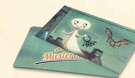
Brieflose | 67 x 38 mm