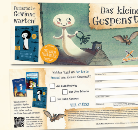
Teilnahme Karte | 210 x 98 mm