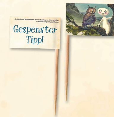
Einsteckfähnchen | 48 x 30 mm