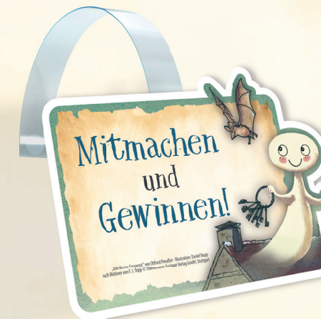
Regalwobbler | 124 x 78 mm